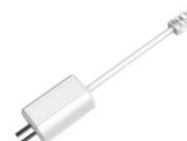
LR1002 ePoE 同軸轉換器