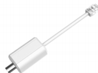
LR1002 e-PoE 同軸轉換器